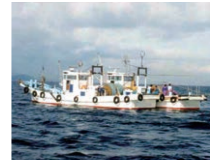
機船船びき網漁業 イカナゴ、イワシ、サヨリ等