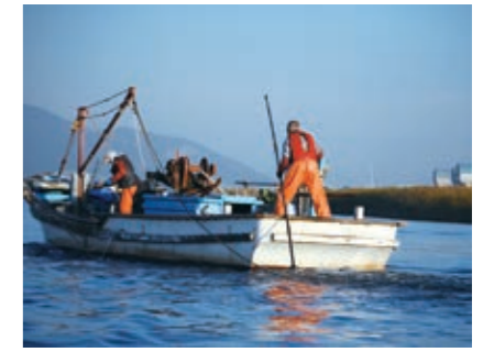
採貝漁業 アサリ、シジミ等