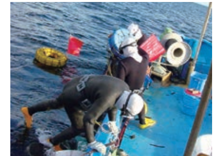
海女(海士)漁 アワビ、サザエ等