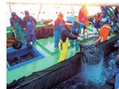
定置網 ブリ、アジ、サバ等