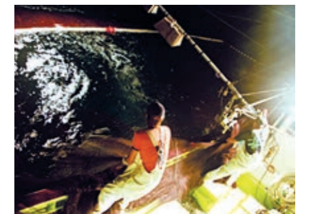
敷網漁業(棒受網) サンマ等