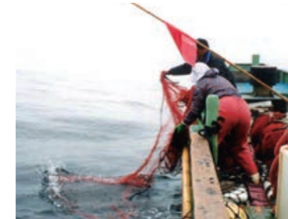
刺し網 イセエビ、カレイ、クルマエビ等