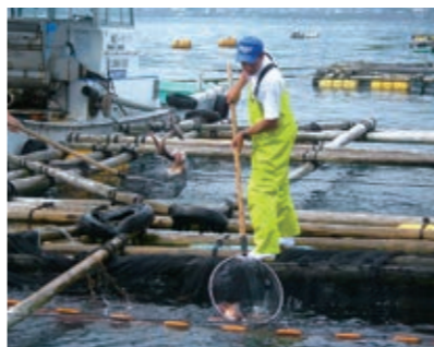
養殖業 黒のり、青のり、かき、真珠、魚類等

主要な漁業の操業動画を三重県漁業協同組合連合会のホームページにアップしていますのでご覧ください。