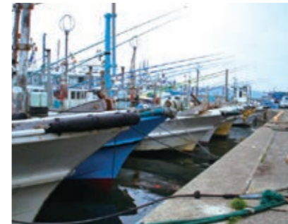
釣漁業 カツオ、マダイ、イサキ、トラフグ等