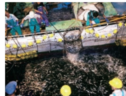
まき網 カツオ、マグロ、アジ、サバ、イワシ等