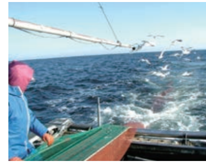
小型底びき網漁業 アナゴ、ヨシエビ、貝類等